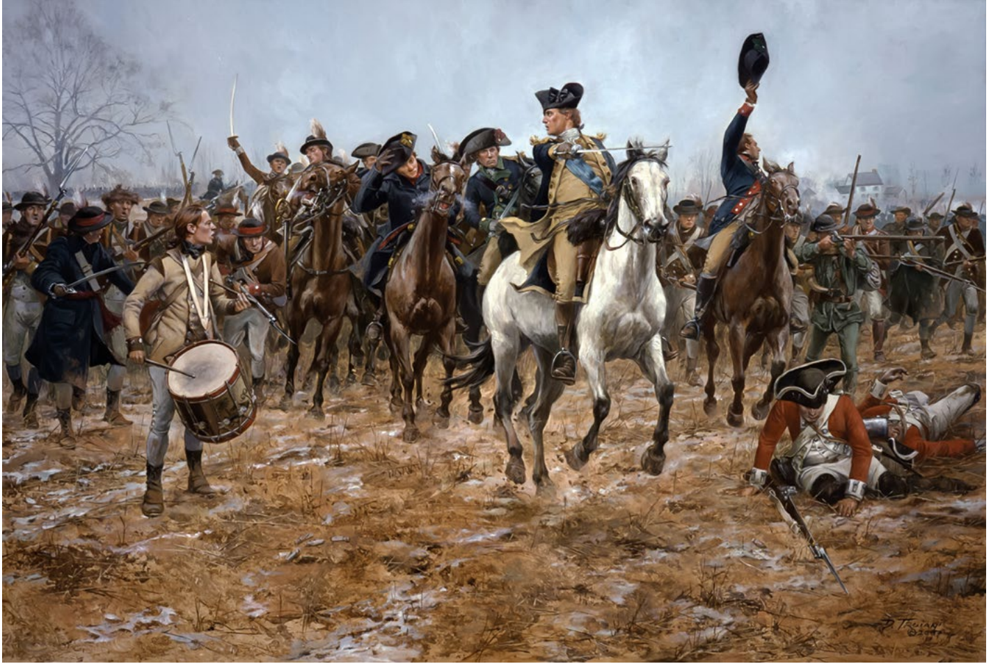
Washington at the Battle of Princeton, 1777 , 2007. Print, 32 ¼ x 25 ¼ in.