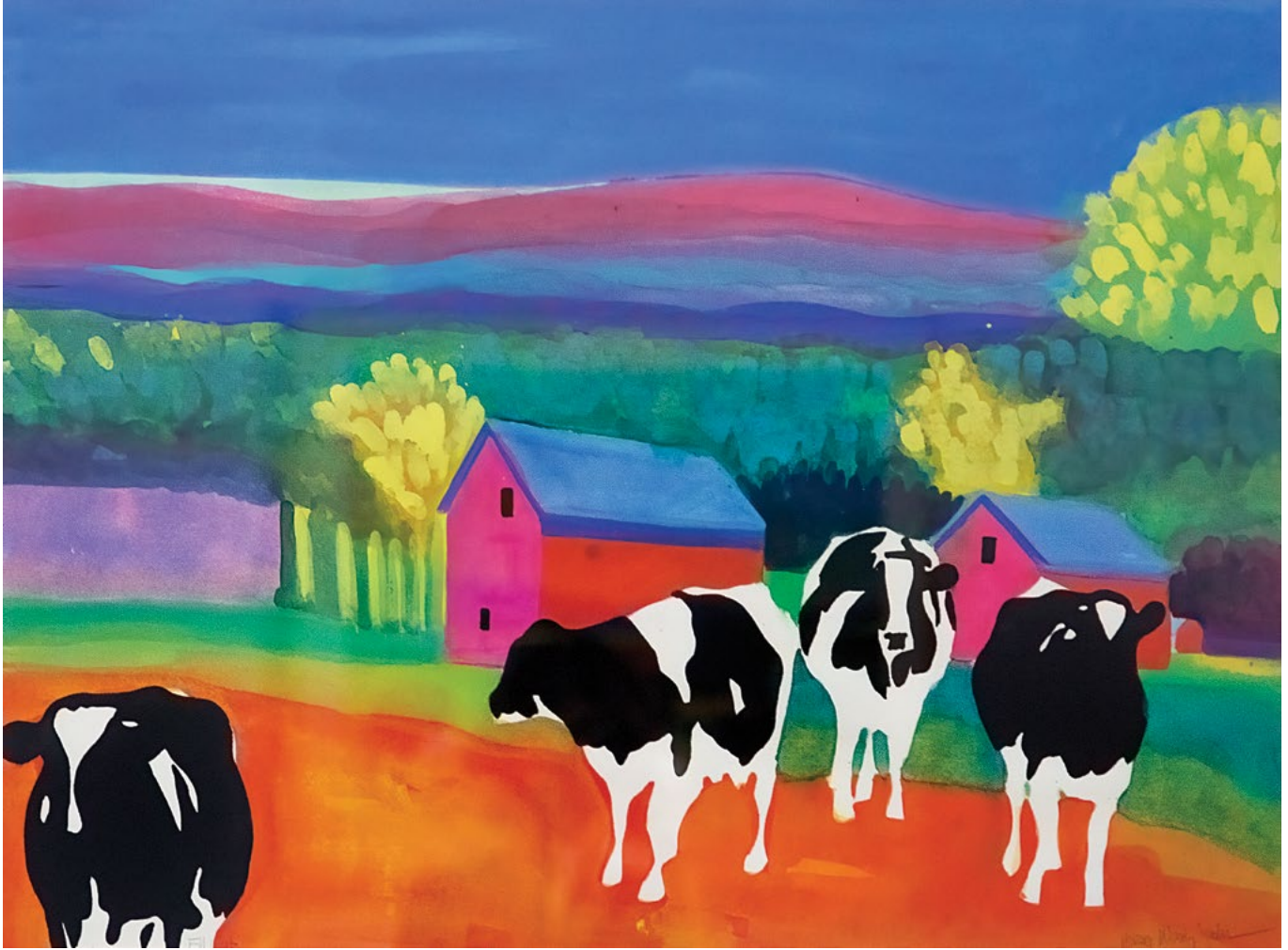
Untitled , 2019. Gouache on paper, 26 x 35 in. Courtesy of the artist, Cornwall, Vermont "Adsız" , 2019. Quaş, kağız, 66 x 88,9 sm. Ressamin icazesi ile, Kornuoll, Vermont