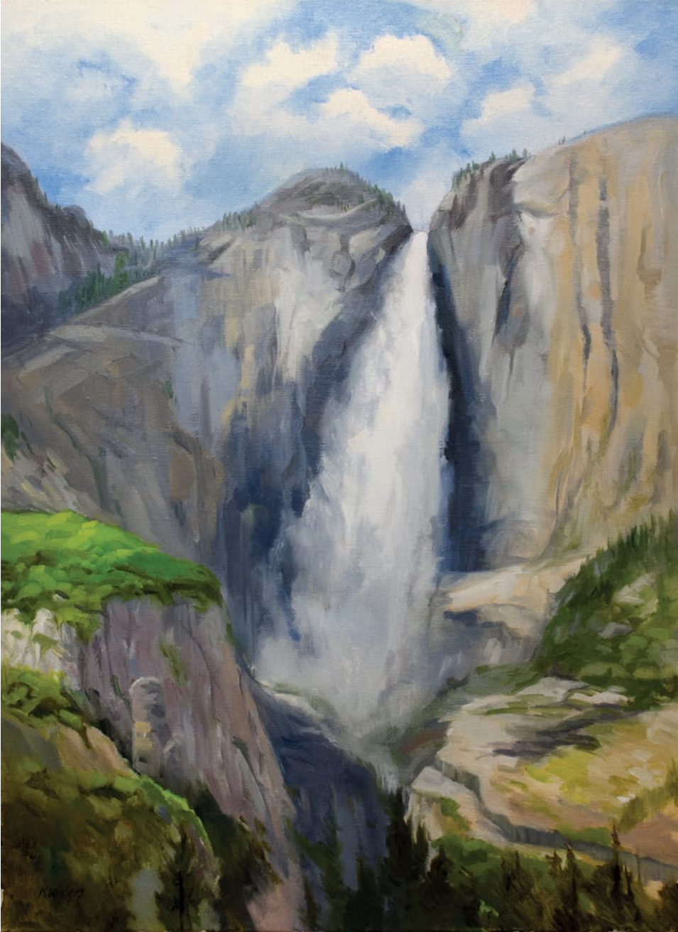
Upper Yosemite Falls, Yosemite National Park , 2015 Oil on canvas, 24 x 18 in. Courtesy of the artist, La Cañada, California “Uxarı Yosemite şelalesi, Yosemite Milli Parkı” , 2015 Yağlı boya, kətan, 61 x 45,7 sm Rəssamın icazəsi ilə, La-Kanyada, Kaliforniya