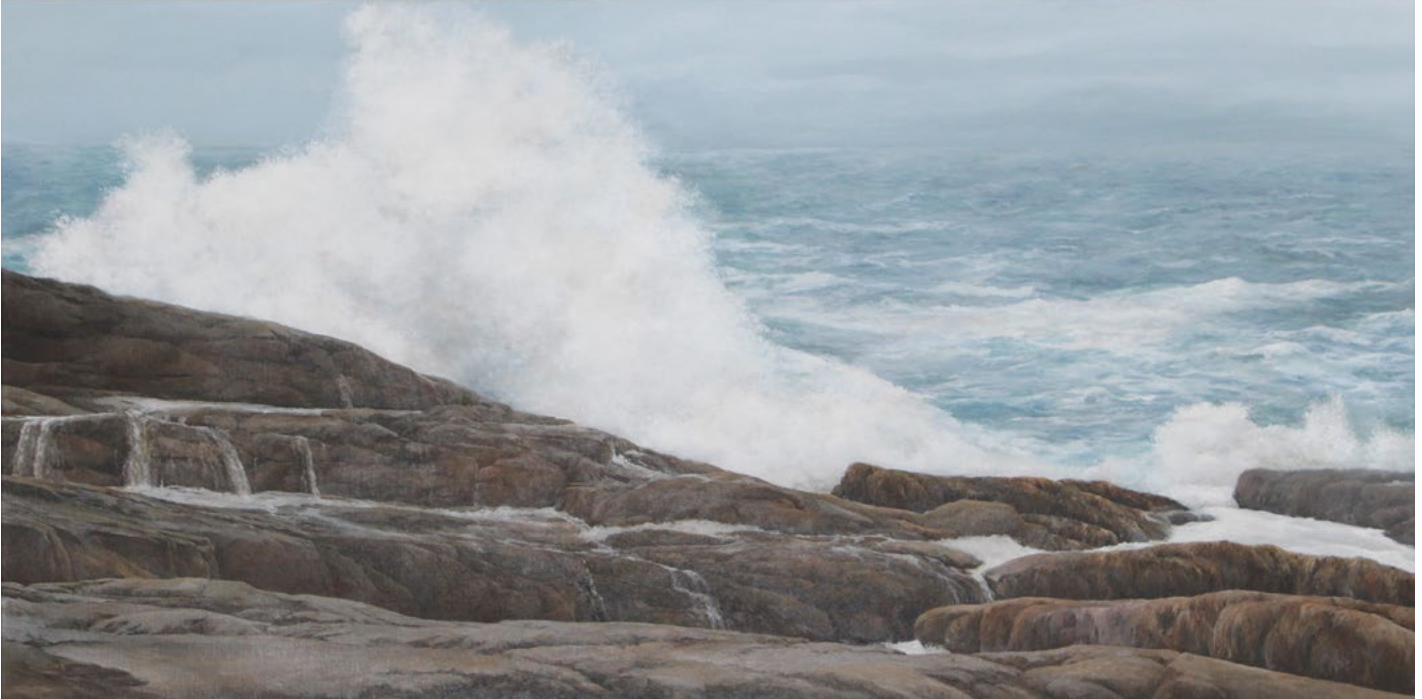
Thunder , 2019. Acrylic on canvas, 48 x 24 in. “Gurultu” , 2019. Akрил, ketan, 121,9 x 61 sm.