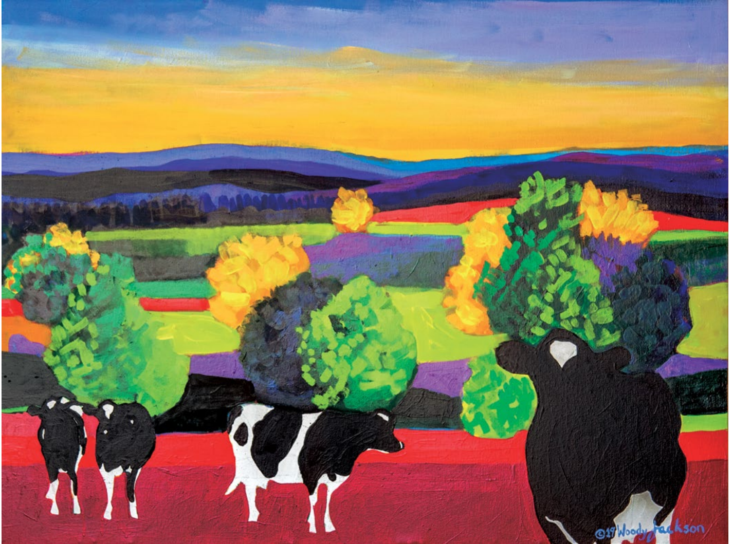
Summer Garden , 2019. Oil on canvas, 30 x 40 in. "Yay bağı" , 2019. Ketan, yağlı boya, 76,2 x 101,6 sm.