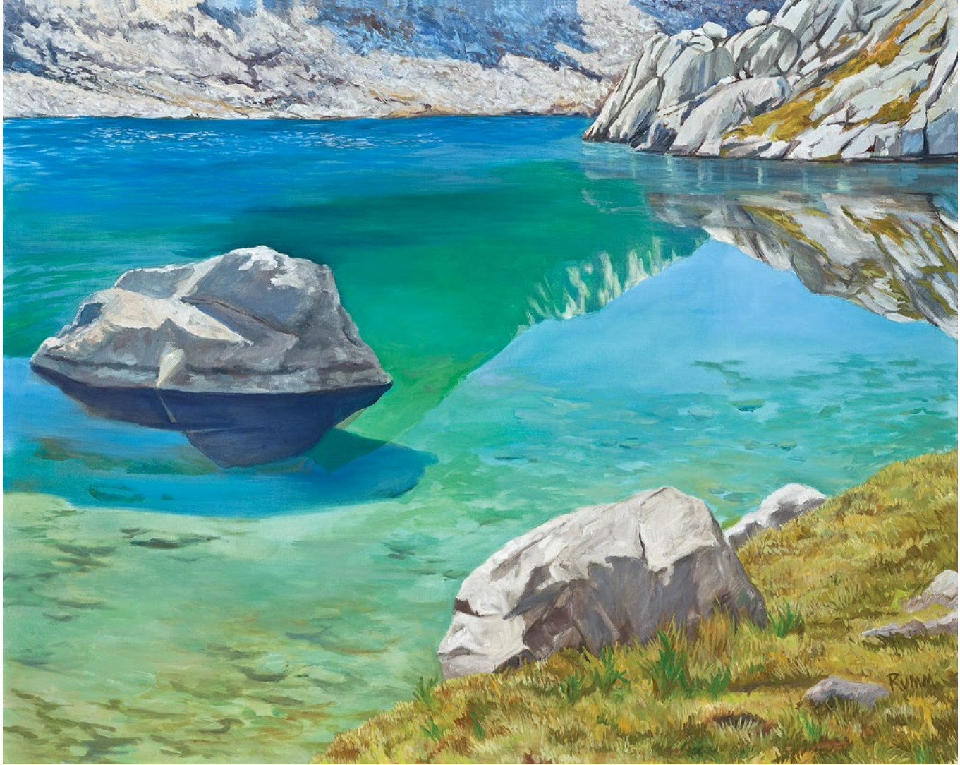
Sapphire Lake, John Muir Trail , 2014. Oil on canvas, 48 x 60 in. "Sapfir gölü, Con Myur Cığırı" , 2014. Yağlı boya, kanvas, 121,9 x 152,4 sm.