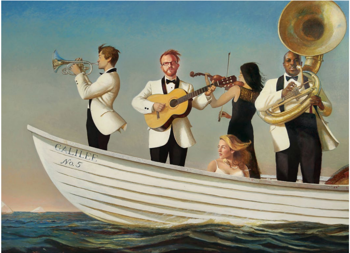
Galilee , 2014. Giclée on canvas, 34 x 48 in. “Qalileya” , 2014. Ketan, Jikle, 86,4 x 121,9 sm.