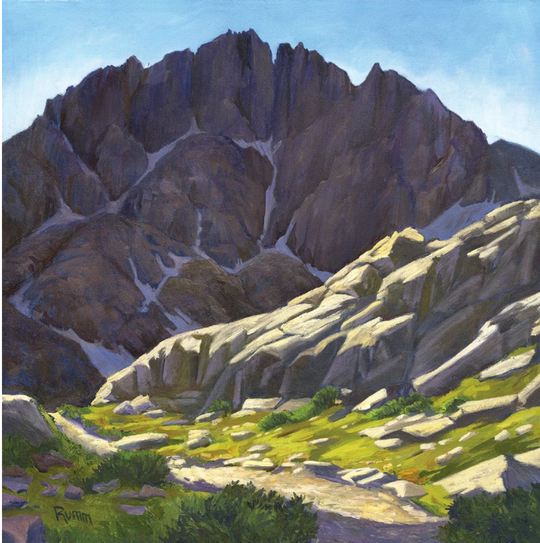
Massif , 2019. Oil on canvas, 38 x 38 in. "Massiv" , 2019. Yağlı boya, kətan, 96,5 x 96,5 sm.