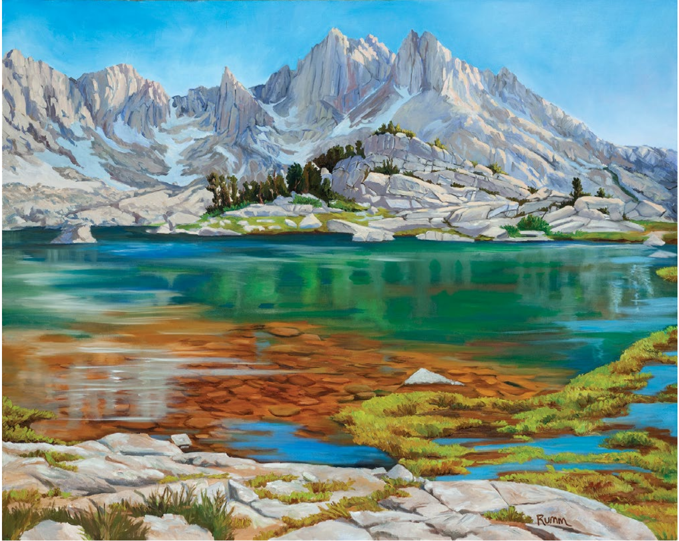
Big Chief Lake, John Muir Trail , 2014. Oil on canvas, 48 x 60 in. Courtesy of the artist, Mariposa, California “Böyük Çif gölü, Con Myur Cığırı” , 2014. Yağlı boya, kətan, 121,9 x 152,4 sm. Rəssamın icazəsi ilə, Mariposa, Kaliforniya