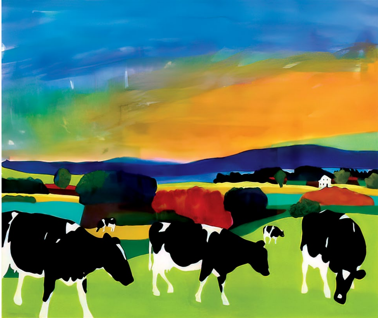
Eastern Horizon , 2019. Gouache, watercolor on paper, 32 x 37 ½ in. “Şərç üfütü” , 2019. Kağız, quaş, akvarel, 81,3 x 95,3 sm.