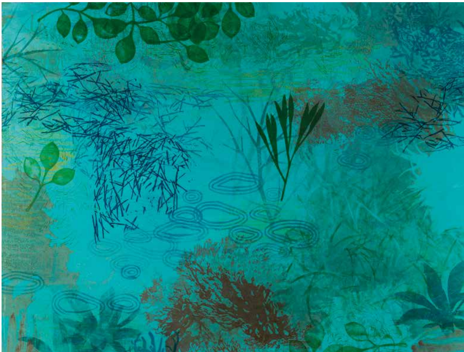
Growth 2 , 2019 Aqua monotype , 22 ¼ x 29 ¾ in.