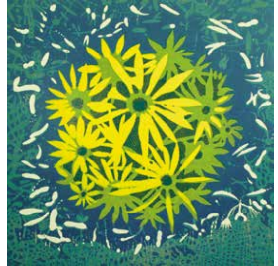
Bloom II, 2011 Woodcut, Edition 1/3, 39 x 39 in. Courtesy of the artist, Alexandria, Virginia

Блум-вар, 36, 2009 Ксилография, выпуск 1/11, 99,1 x 99,1 см Предоставлено автором, Александрия, Вирджиния