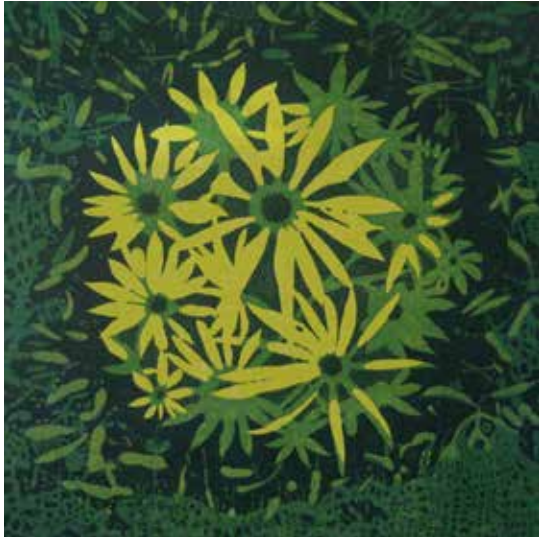
Bloom-var, 32, 2008 Woodcut, Edition 1/1, 39 x 39 in. Courtesy of the artist, Alexandria, Virginia

Блум-вар, 32, 2008 йил Ёғоч гравюраси, 1/1 наshr, 99,1 x 99,1 см Рассом томонидан тақдим қилинган, Виржиния, Александрия