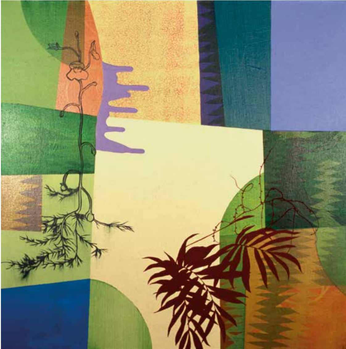
Terrestrial Growth 3, 2013 Aqua monotype, 30 x 22 ¼ in. Courtesy of the artist, Cleveland, Ohio