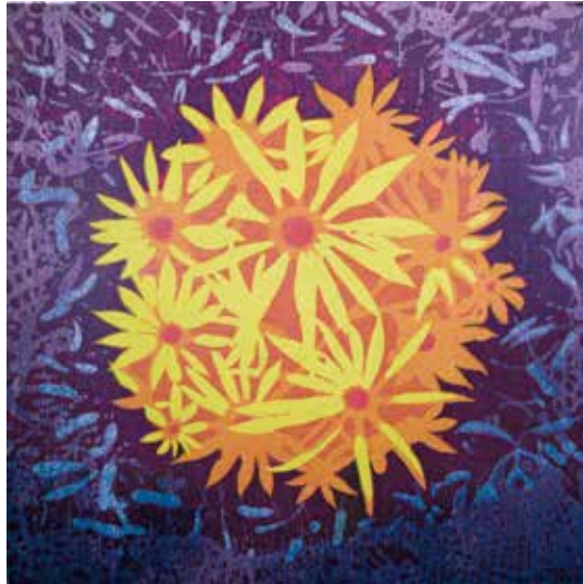
Bloom-var, 36, 2009 Woodcut, Edition 1/11, 39 x 39 in. Courtesy of the artist, Alexandria, Virginia

Блум-вар, 32, 2008 Ксилография, выпуск 1/1, 99,1 x 99,1 см Предоставлено автором, Александрия, Вирджиния