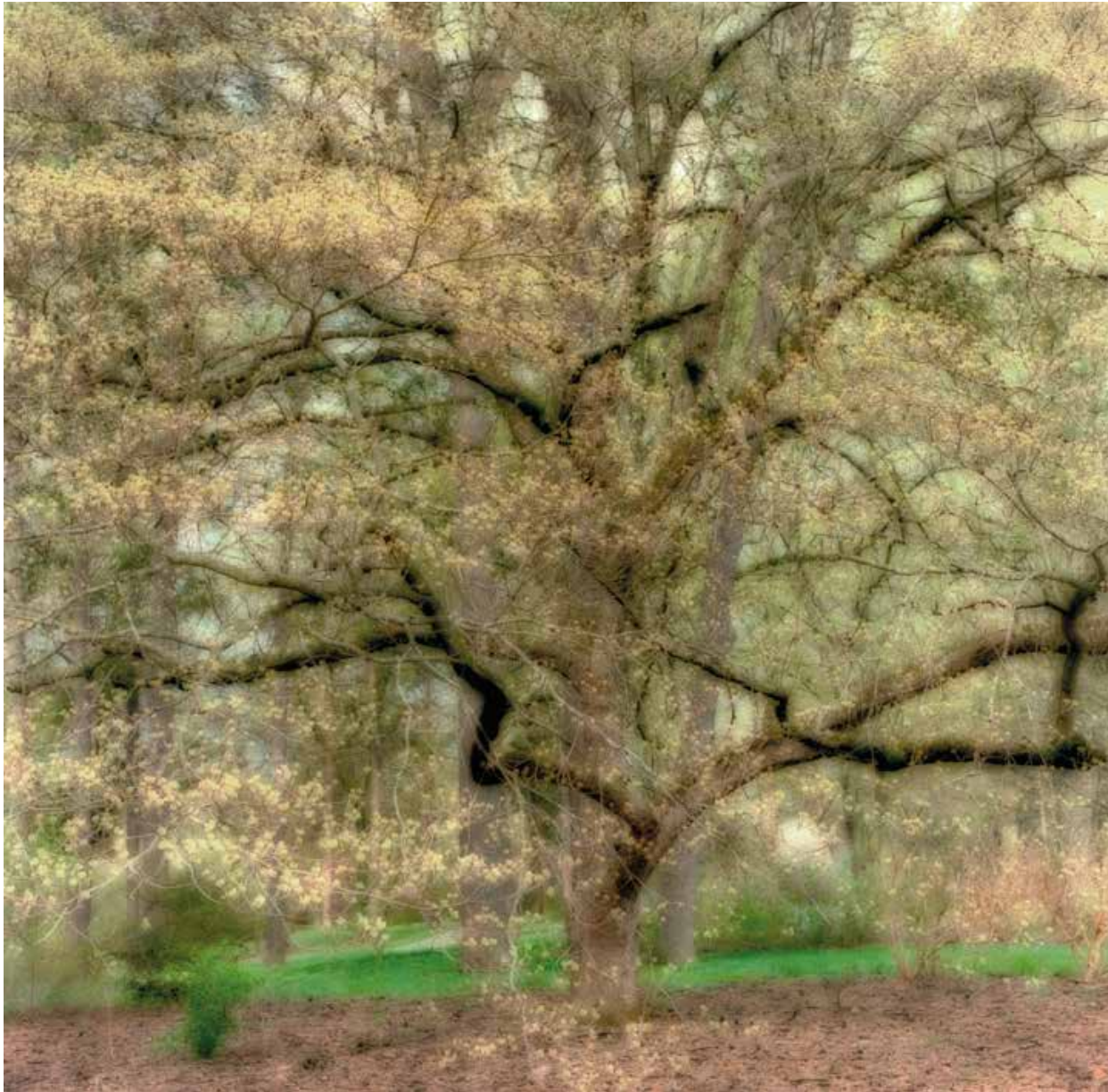
Bernheim Arboretum, Kentucky, 2008 Chromogenic print, Edition 1/15, 28 x 28 in.