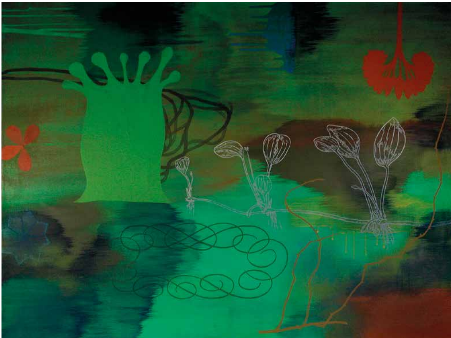
Terrestrial Growth 3, 2013 Aqua monotype, 30 x 22 ¼ in.