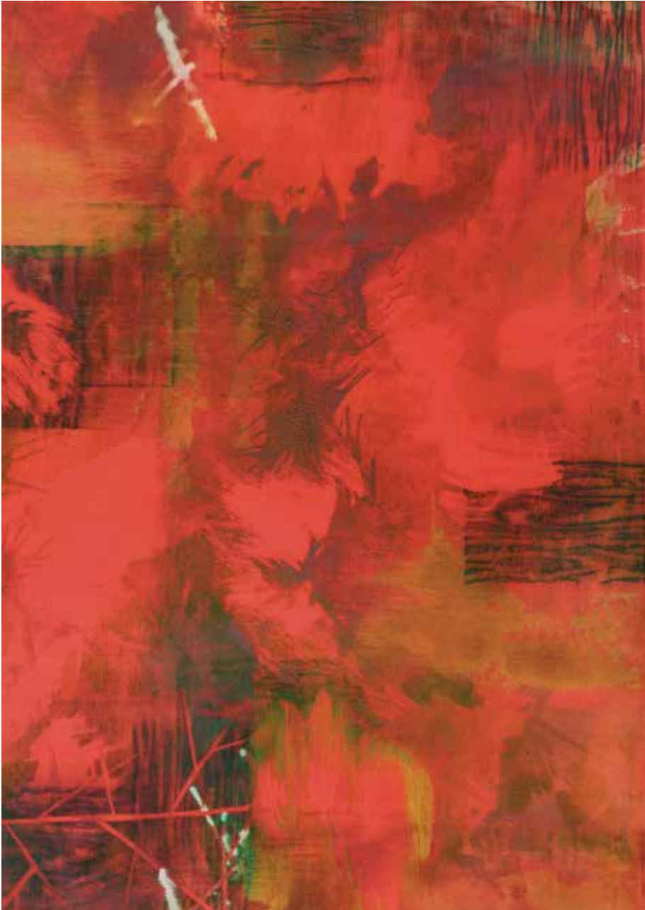
Terrestrial Growth 3, 2013 Aqua monotype, 30 x 22 ¼ in.