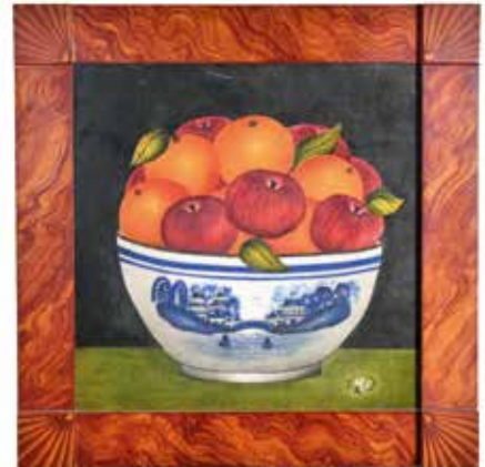
Fampitahana tany Canton , tsy misy daty Pigment sur velours, 53,7 x 56,2 cm. Nahazoana alàlana tamin'ny Zava-kanto any amin'ny Masoivoho, Washington, D.C.; Fanomezana avy amin'ny Fikambanana ho n'ny Azva-kanto sy Fitandroana vakoka any amin'ny Masoivoho, Washington, D.C.