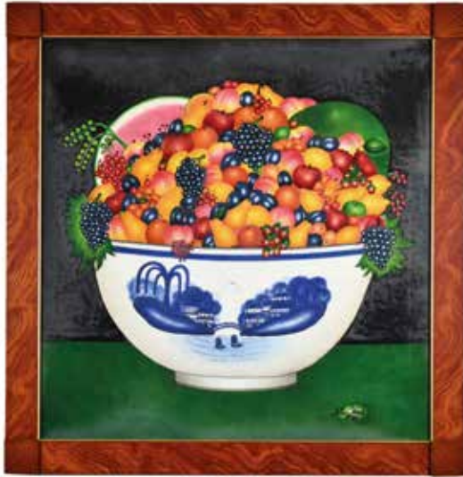
Yes We Have No Bananas , circa 1995 Pigment on velveteen, 46 x 48 in. Courtesy of the artist, Oley, Pennsylvania