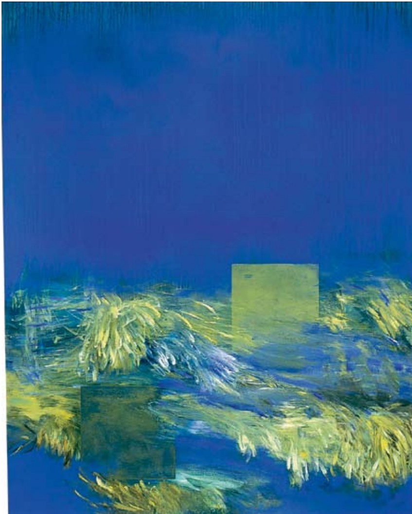
Low Falls, 2002

Acrylic on canvas, 60 x 48 in.