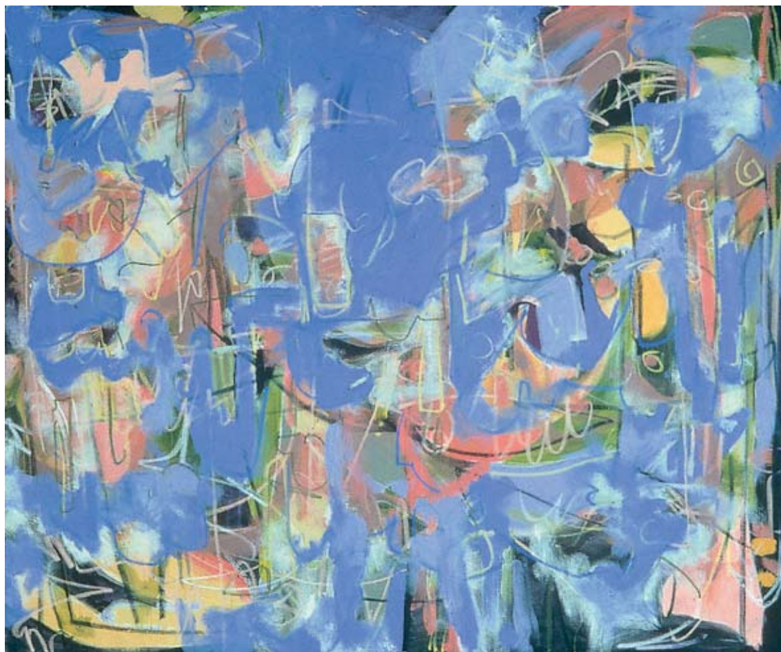
May Flowers, 2003

Acrylic on canvas, 60 x 72 in.