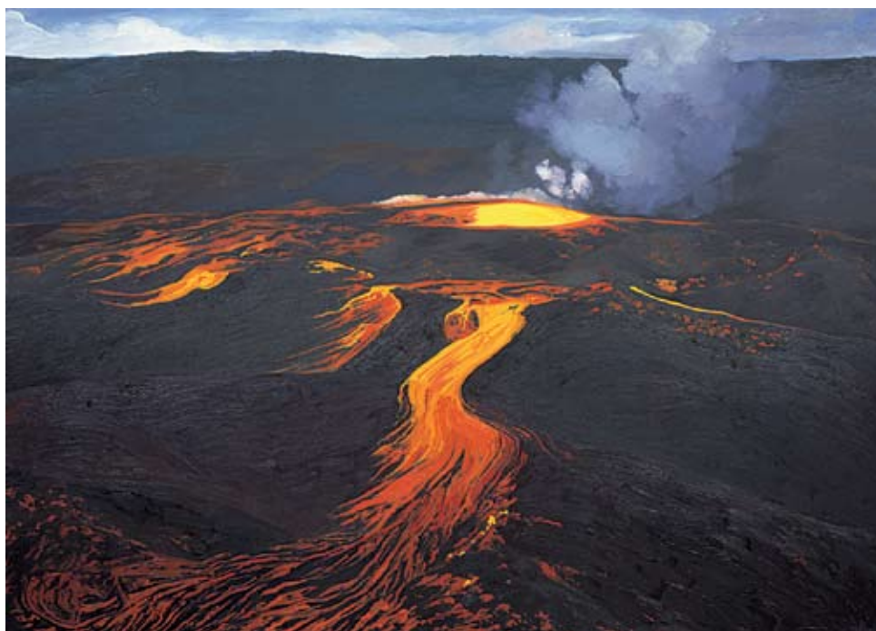
Halema'uma'u Crater #1, 1961

Oil on canvas, 60 x 84 in. Courtesy of the artist, Philadelphia, Pennsylvania