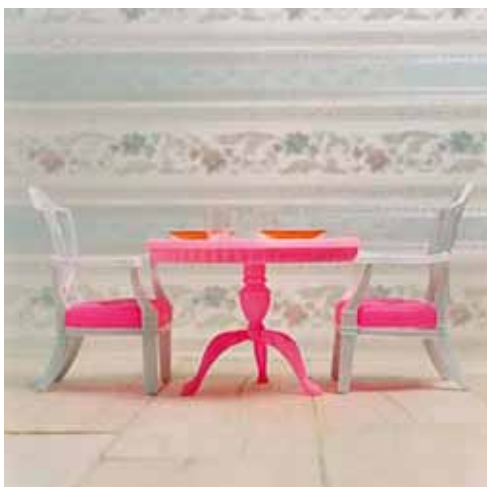
Home Sweet Home #3, 2008

Constellation (Woodrooms), 2002 Color spitbite aquatint with drypoint 46 x 36 1/2 in. (116.8 x 92.7 cm)