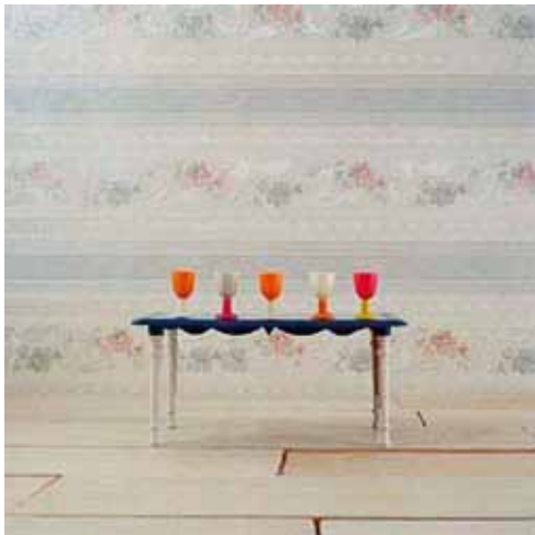
Home Sweet Home #2, 2008