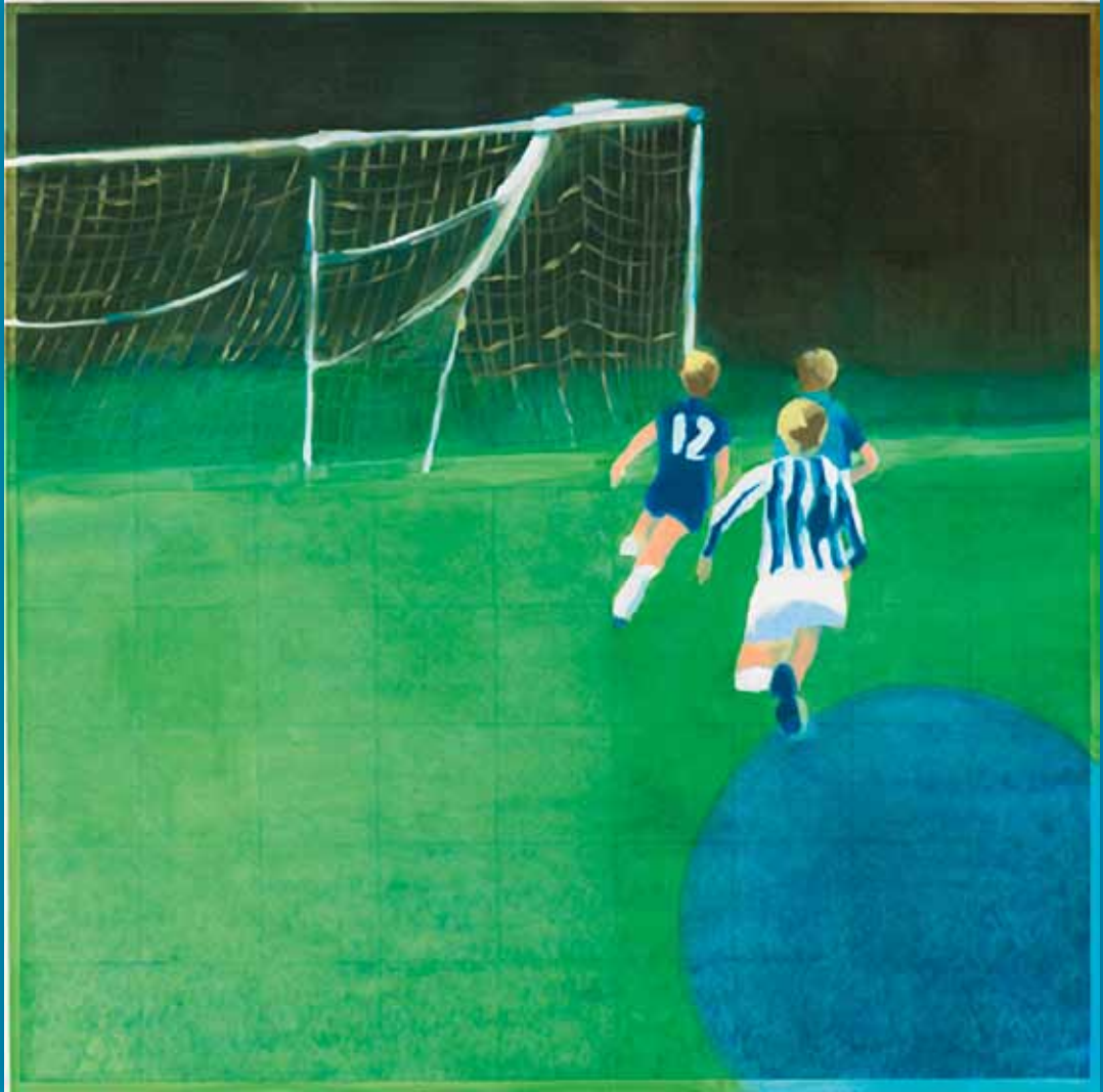
ART in Embassies Exhibition United States Embassy Tel Aviv