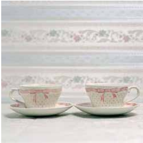
Home Sweet Home #1, 2008