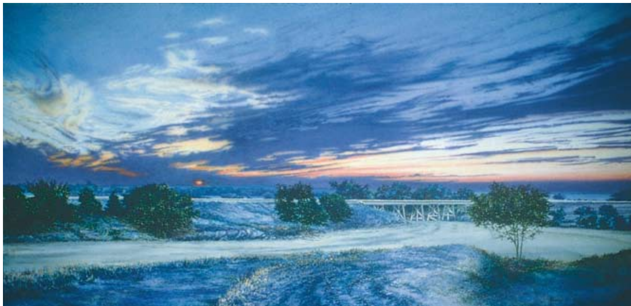
Prairie Sky #8 , 1991. Transparent watercolor, 25 x 52 1/8 in. Collection of the artist, Champaign, Illinois