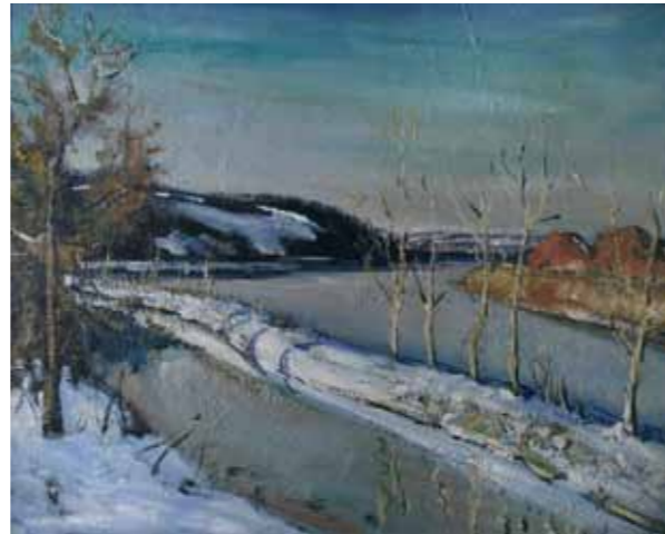
Дарёи Манзаравӣ, Канал, санааш номаълум Бо ранги равшанӣ дар катон, 97,2 x 117,5 см. Тӯҳфаи Ҷаноб ва Хонуми Филип Берман ба барномаи Санъат дар Сафоратхонаҳо, Вашингтон, Ҷавзаи Колумбия