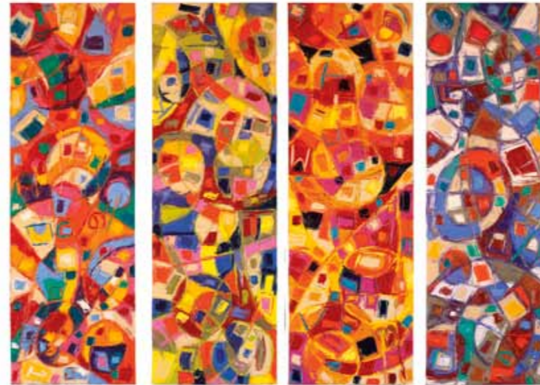
Тахайюл (чоргона) , 2010 Бо ранги равшанӣ дар катон, масоҳати умумиаш 182,9 x 274,3 см; ҳар яке: 182,9 x 61 см Лутфи рессом, Скотсдэйл, Иёлоти Аризон