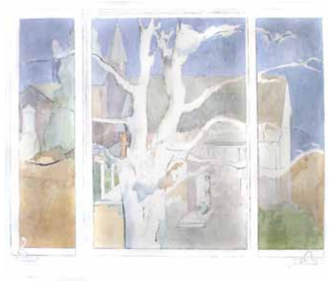
Аз силсилаи "Тиреза", санааш номаълум Саннааш номаълум Бо ранги равшанӣ дар катон, 135x155,5 см. Тӯҳфаи рассом ба барномаи Санъат дар Сафоратхонаҳо, Вашингтон, Ҷавзаи Колумбия