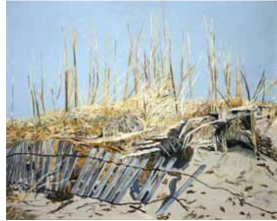
Экостасис II (сукути табиат) , санааш номаълум Бо ранги равшанӣ дар рӯи мазолит, 66 x 76,2 см. Тӯҳфа аз молу мулки Нэнси Лонг Эарсон ба барномаи САНЪАТ дар Сафоратхонаҳо, Вашингтон, Ҳавзаи Колумбия