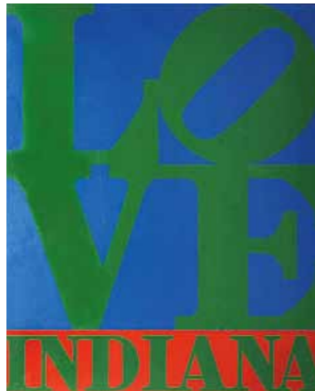
Ишқ Эълоннома (постер), 76,2 x 63,5 см Лутфи барномаи САНЪАТ дар Сафоратхонаҳо, Вашингтон, Ҷавзаи Колумбия