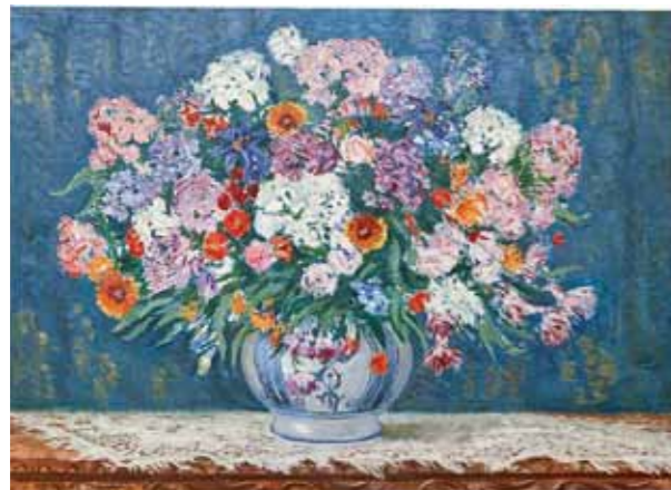
Гулҳо , тақрибан с. 1928 Бо ранги равшанӣ дар катон, 99,1 x 130,8 см. Тӯҳфа аз нигористони Краушаар дар ш. Нью Йорк ба барномаи САНЪАТ дар сафоратхонаҳо, Вашингтон, Ҳавзаи Колумбия