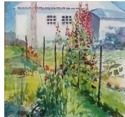
Барфи Аввалин, санааш номаълум Бо ранги равшанӣ дар катон, 81x101,5 см. Тӯҳфаи Ҷаноби ва Хонум Филип Берман ба барномаи Санъат дар Сафоратхонаҳо, Вашингтон, Ҷавзаи Колумбия