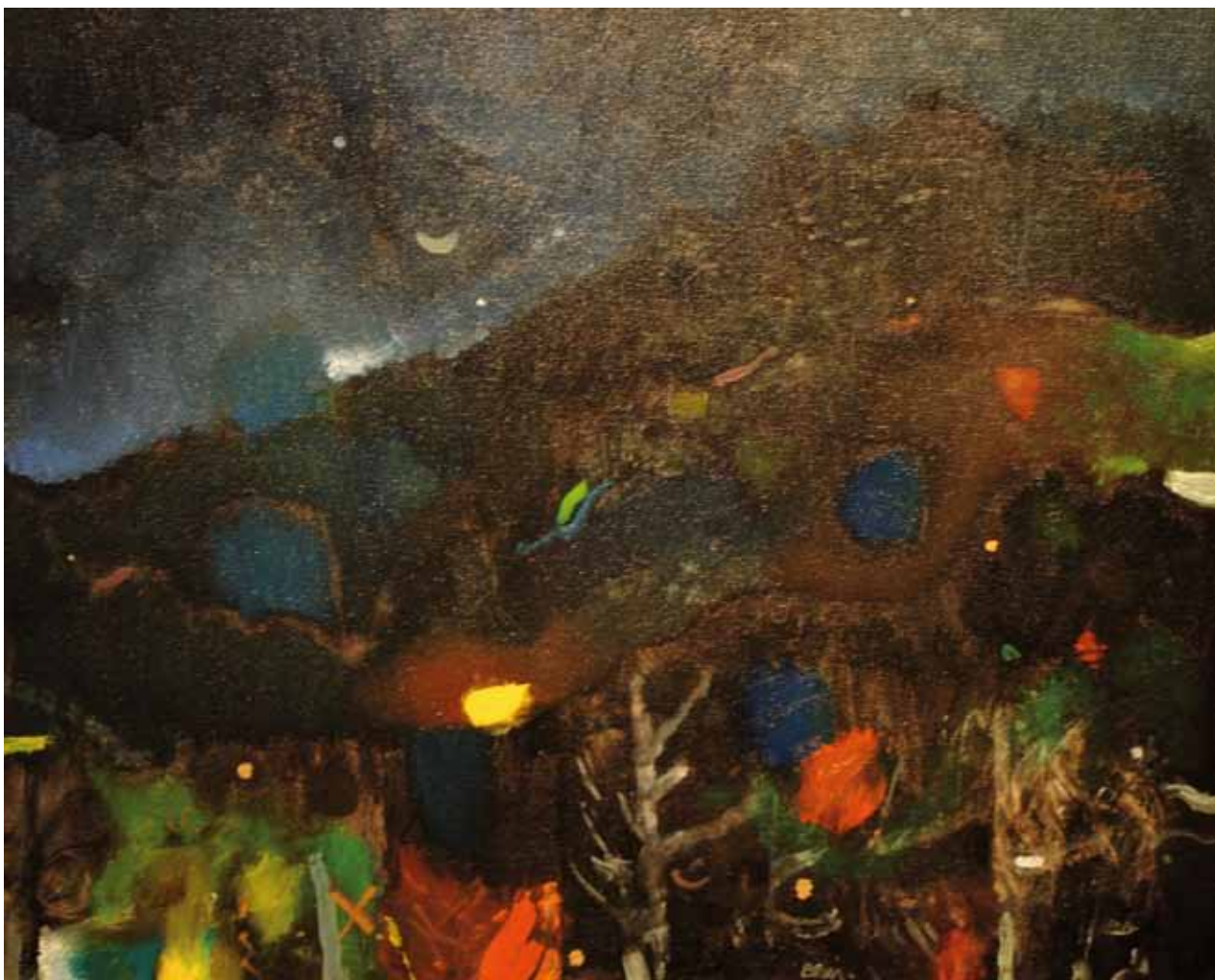
BLAIR Night Signal , 2004. Acrylic on canvas, 20 x 24 in.