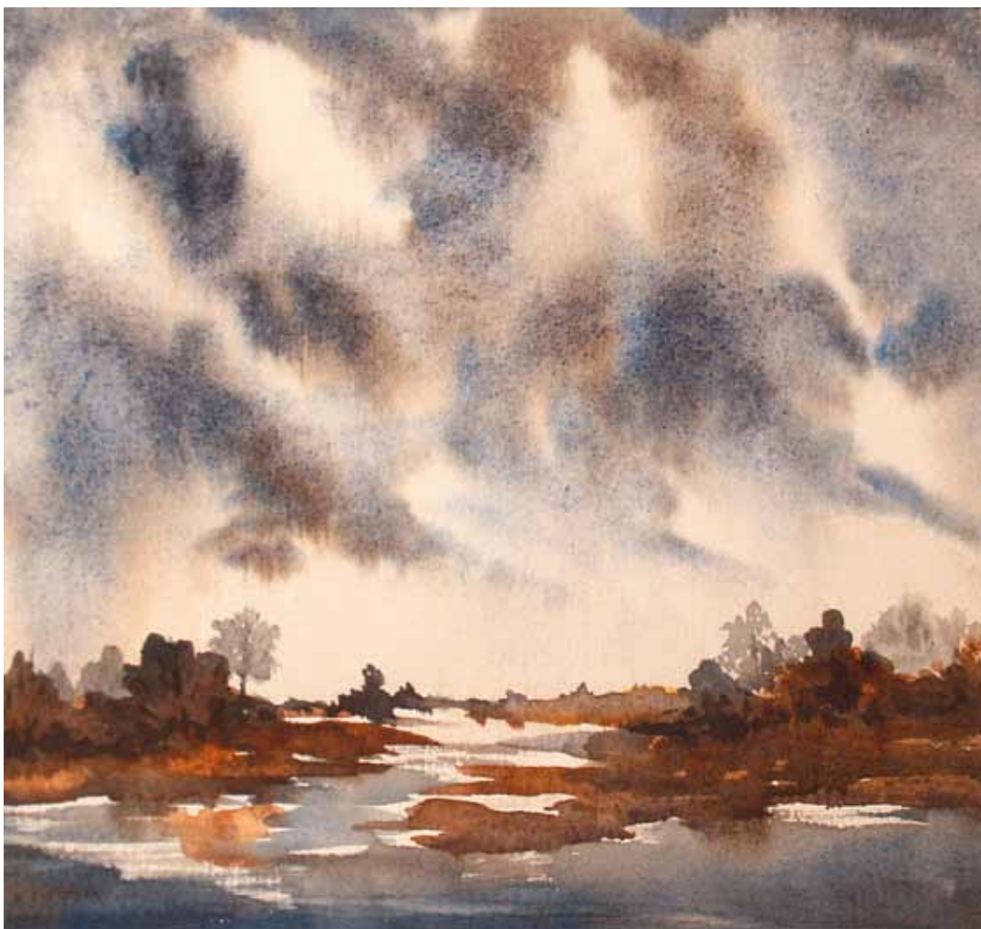
FREDERICK Bayou Storm , undated Watercolor on paper, 9 ½ x 11 ½ in.