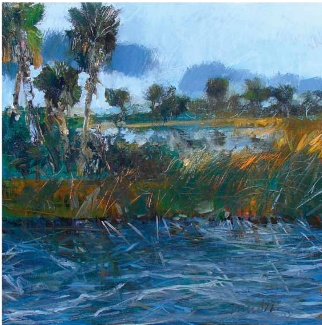
WILLIAMS Point 26 , 2008. Acrylic and ink on canvas, 36 x 36 in. Courtesy of the artist, Columbia, South Carolina WILLIAMS Punctul 26 , 2008. Acrilic și cerneală pe pânză, 91,4 x 91,4 cm. Prin amabilitatea artistului, Columbia, statul Carolina de Sud