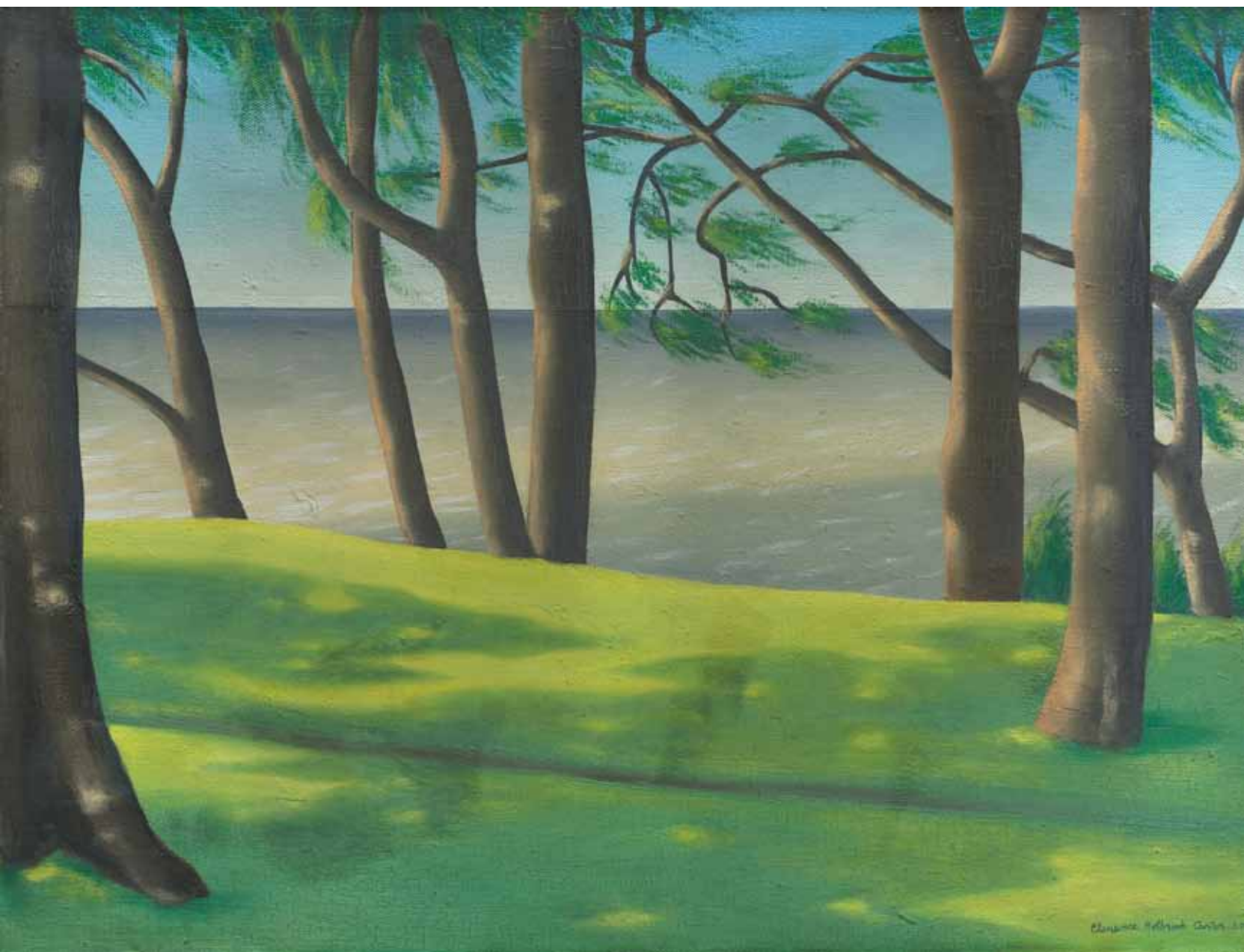
Lake Erie Patterns , 1930. Oil on canvas, 20 ½ x 26 ½ in. Courtesy of The Cleveland Museum of Art, Cleveland, Ohio Gift of Miss Madeleine Williams in memory of Mr. and Mrs. Edward M. Williams, 1972.326

Podoby jazera Erie , 1930. Olej na plátne, 52,1 x 67,3 cm. Zapožičalo Cleveland Museum of Art, Cleveland v štáte Ohio Dar pani Madeleine Williamsovej na pamiatku pána Edwarda M. Williama a jeho manželky, 1972.326