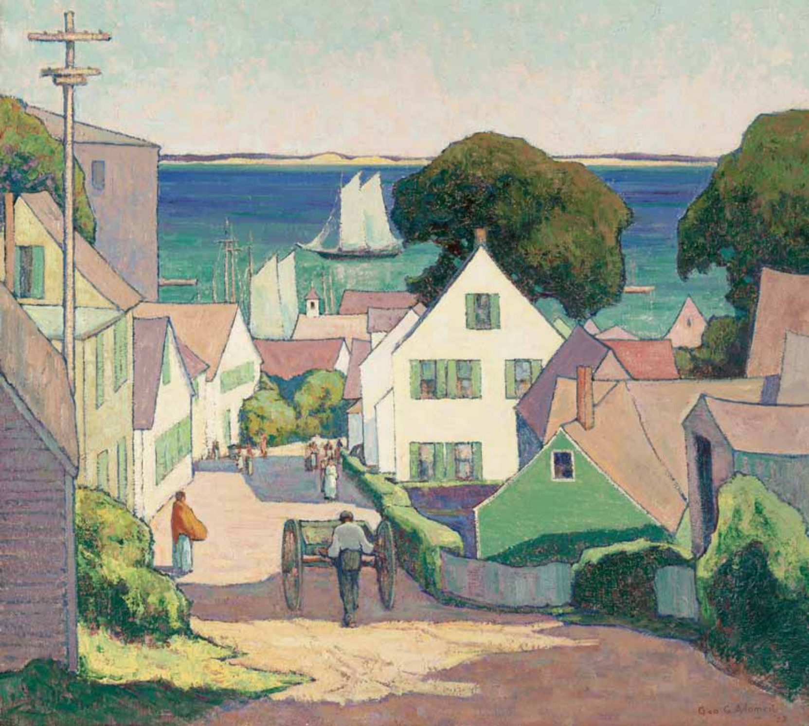
Down to the Harbor , 1925. Oil on canvas, 36 x 40 in. Gift of the Cleveland Art Association, 1925.801

Nadol k prístavu , 1925. Olej na plátne, 91,5 x 101,6 cm Dar Cleveland Art Association, 1925.801