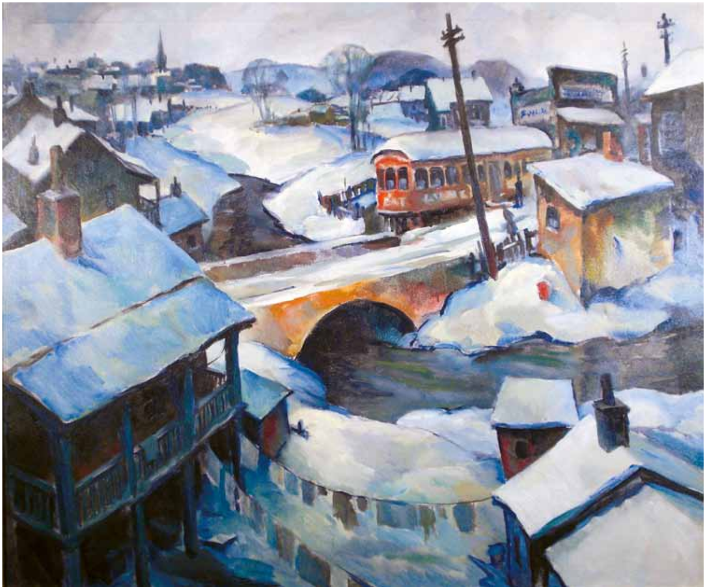
Dark Town , 1930s. Oil on canvas, 35 ½ x 41 ½ in. Courtesy of the Cleveland Artists Foundation, Lakewood, Ohio. Gift of the Cleveland Society of Artists Temné mesto , 30. roky 20. storočia. Olej na plátne, 90,2 x 105,4 cm Zapožičala Cleveland Artists Foundation, Lakewood v štáte Ohio. Dar Cleveland Society of Artists