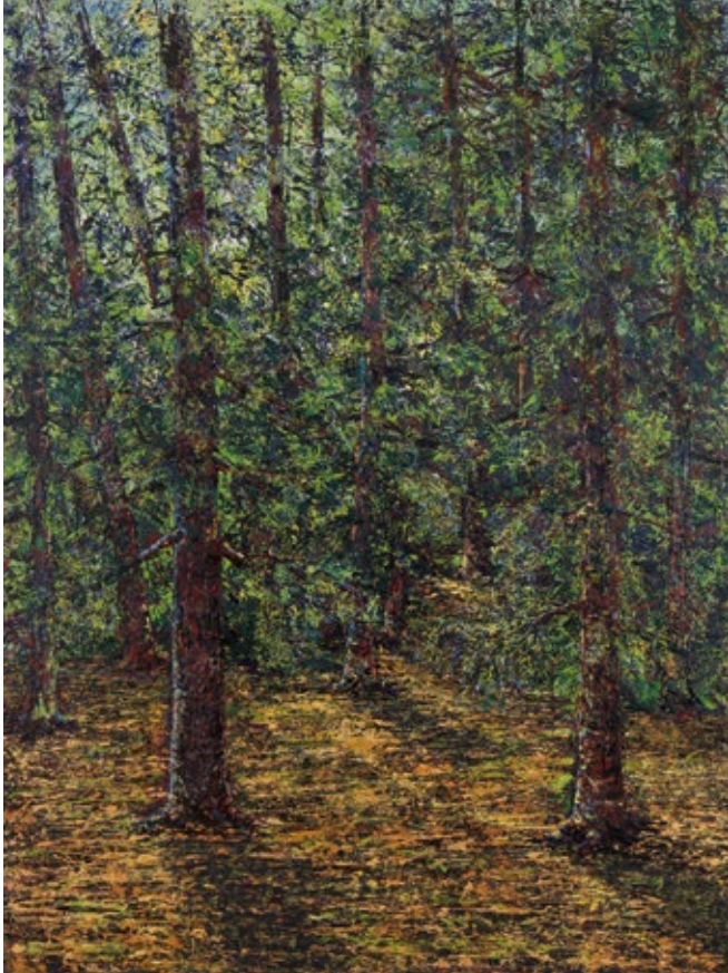
Silence , undated Oil on board, 64 x 48 in.

“Keçid” , tarihi gösterilmemiştir Lövhe üzerinde yağlı boya ile çekilmiş resm, 121.9 x 182.9 sm