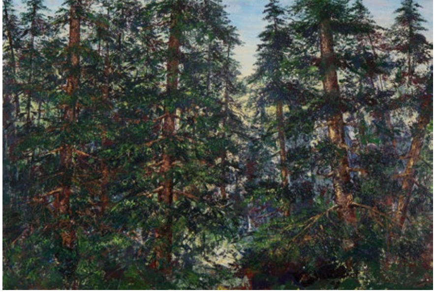
Passage , undated Oil on board, 48 x 72 in. Courtesy of the artist, Camden, Maine

“Keçid” , tarihi gösterilmemiştir Lövhe üzerinde yağlı boya ile çekilmiş resm, 121.9 x 182.9 sm Müellifin icazesi ile: Kamden, Men