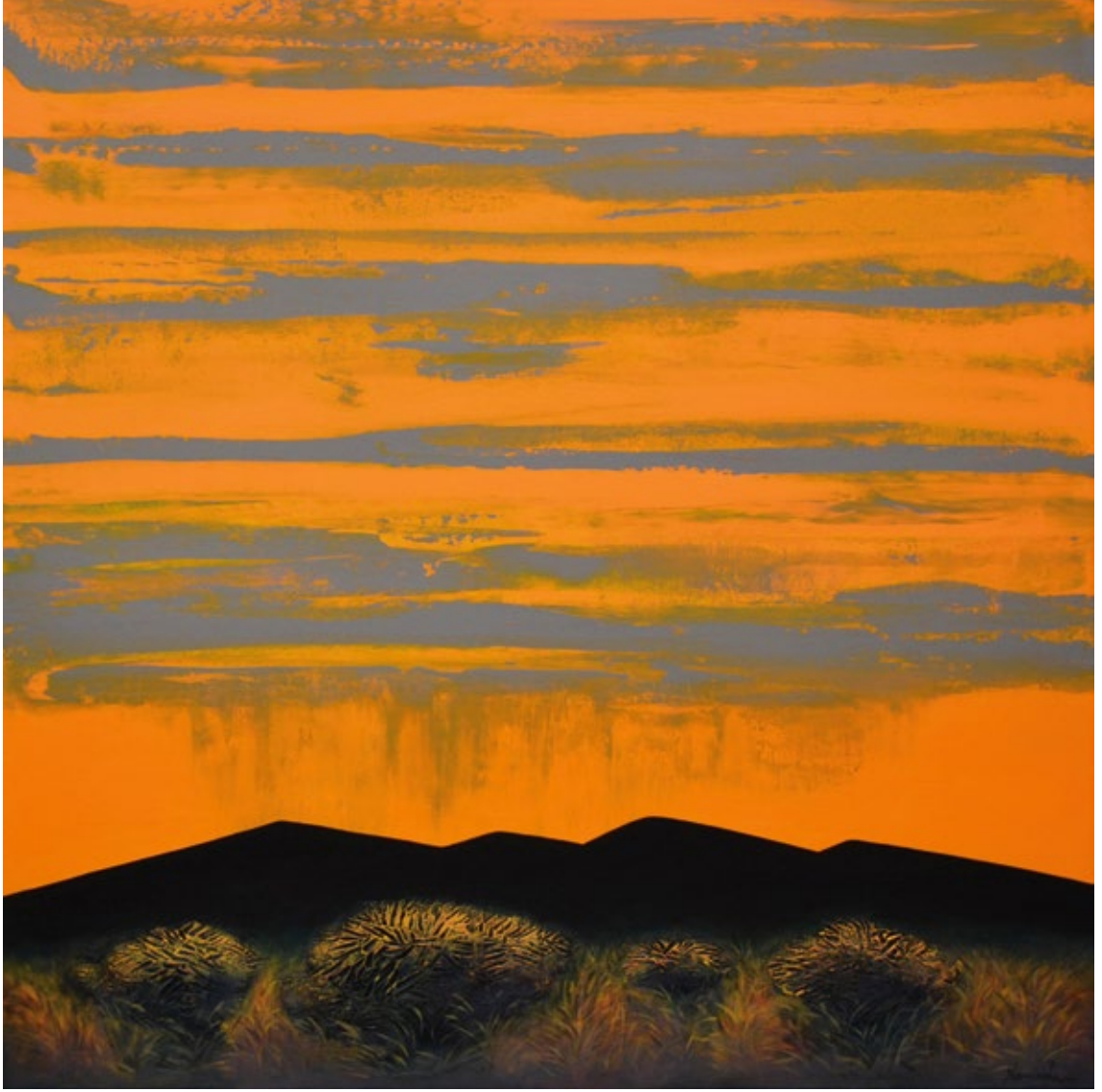
Morning Showers #1 , undated Acrylic on canvas, 40 x 40 in.

“Sübh leysanı nömrə 1” , tarixi göstərilməmişdir Kətan üzərində akril boya ilə çəkilmiş rəsm, 101.6 x 101.6 sm