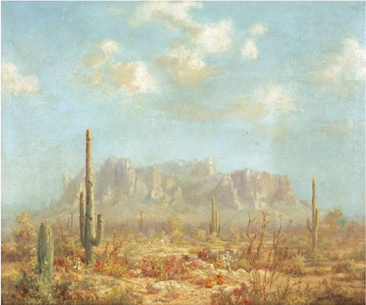
DAVID SWING Superstition Mountain , 1931

Oil on canvas, 28 1/2 x 32 1/2 in. (72,4 x 82,5 cm). Courtesy of the ART in Embassies Program, Washington, D.C.; Gift of Gertrude Berg