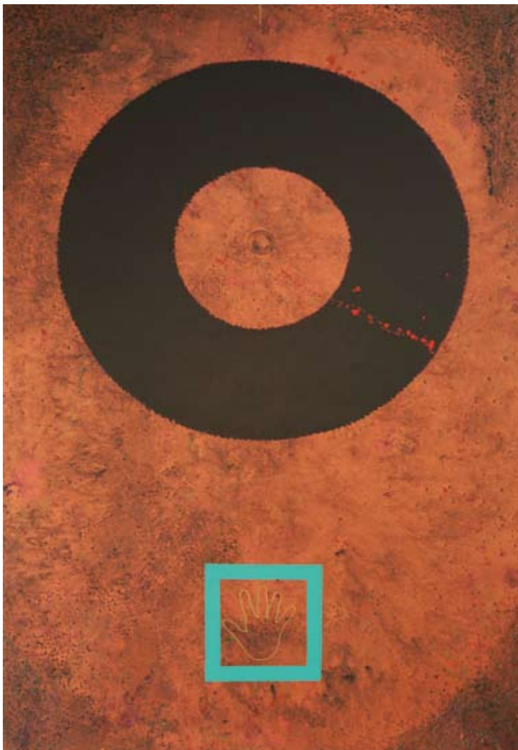
DOUGLAS J. COFFIN Hoo Doo Dream #1 , 2008 Acrylic on canvas, 72 x 60 in. (182,9 x 152,4 cm).