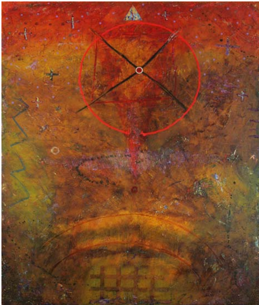
DOUGLAS J. COFFIN Into the Mystery , 2006 Acrylic on canvas, 72 x 48 in. (182,9 x 121,9 cm).