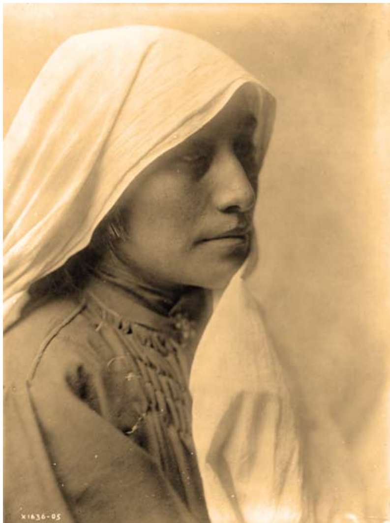
EDWARD S. CURTIS A Taos Woman , 1905 Photogravure, 27 x 24 in. (68,6 x 61 cm).