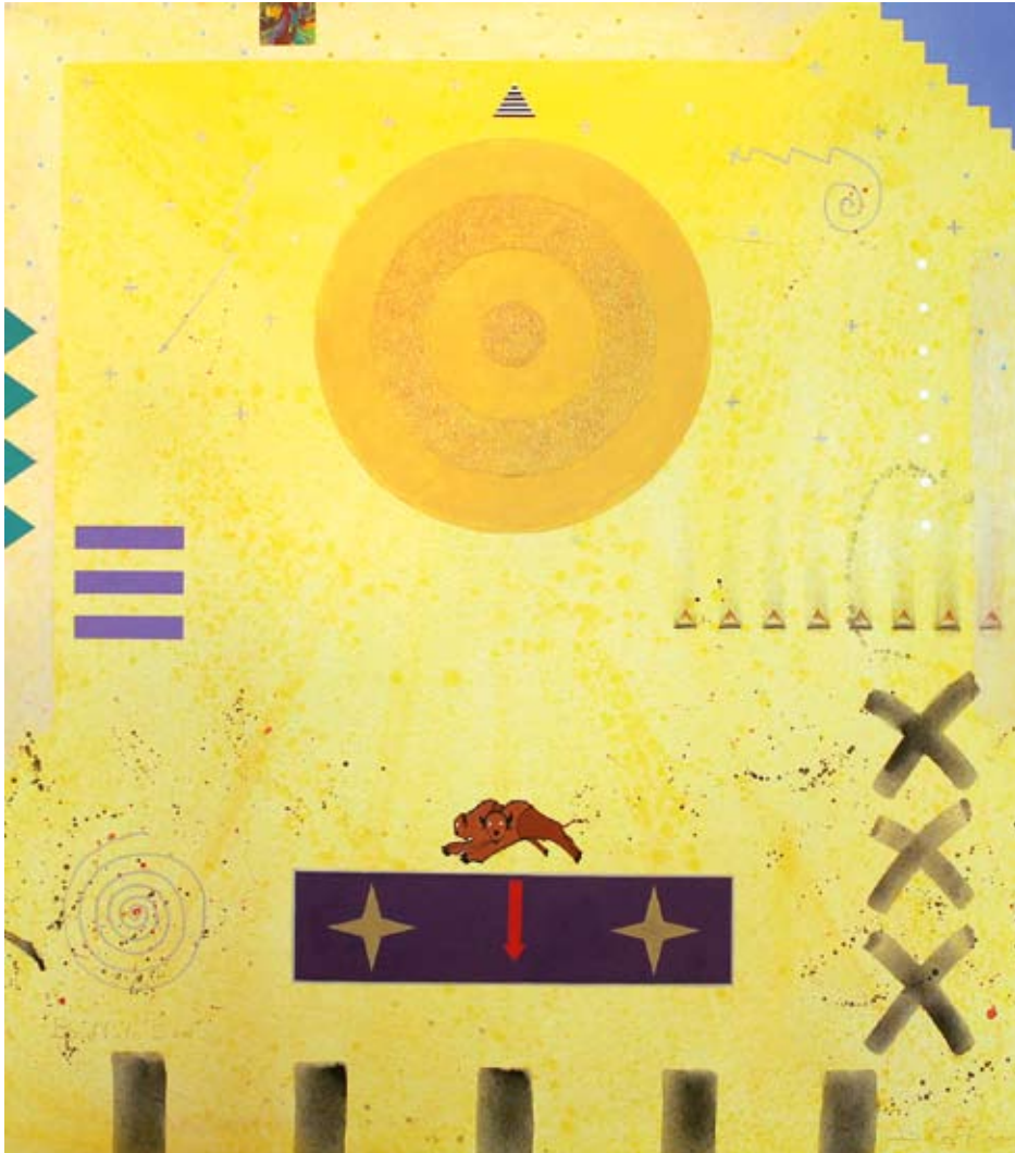
DOUGLAS J. COFFIN Buffalo Sun Series , 2004 Acrylic on canvas, 54 x 48 in. (137,2 x 121,9 cm).