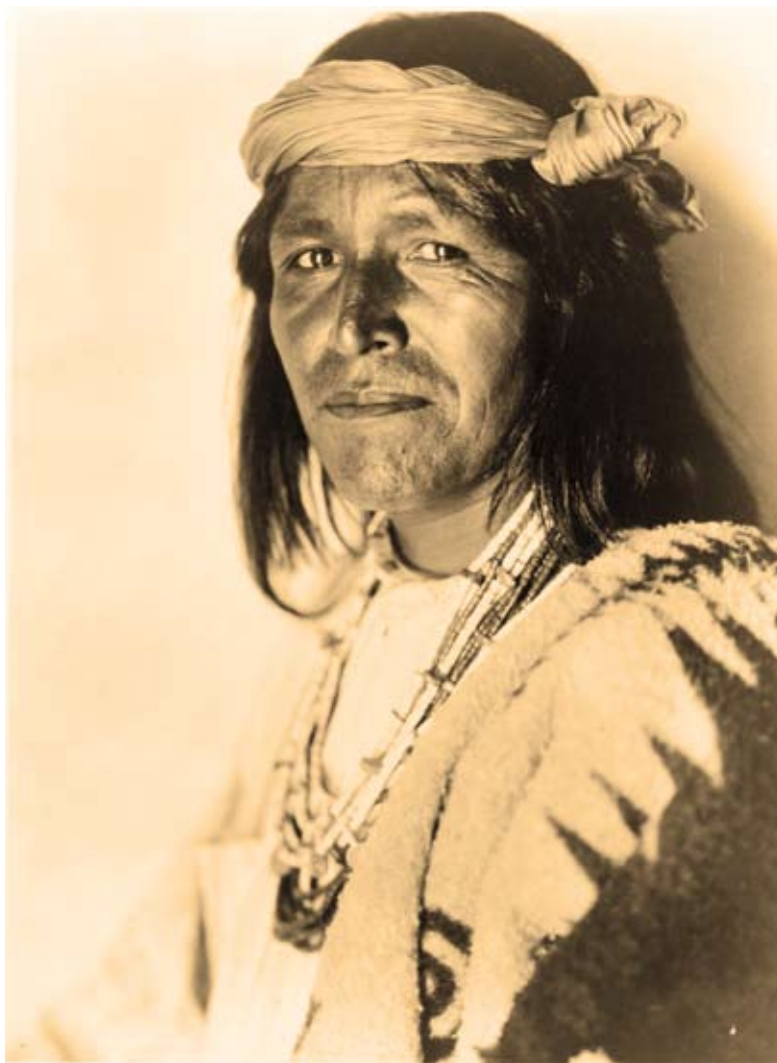
EDWARD S. CURTIS A Jemez Fiscal , 1925 Photogravure, 27 x 24 in. (68,6 x 61 cm).