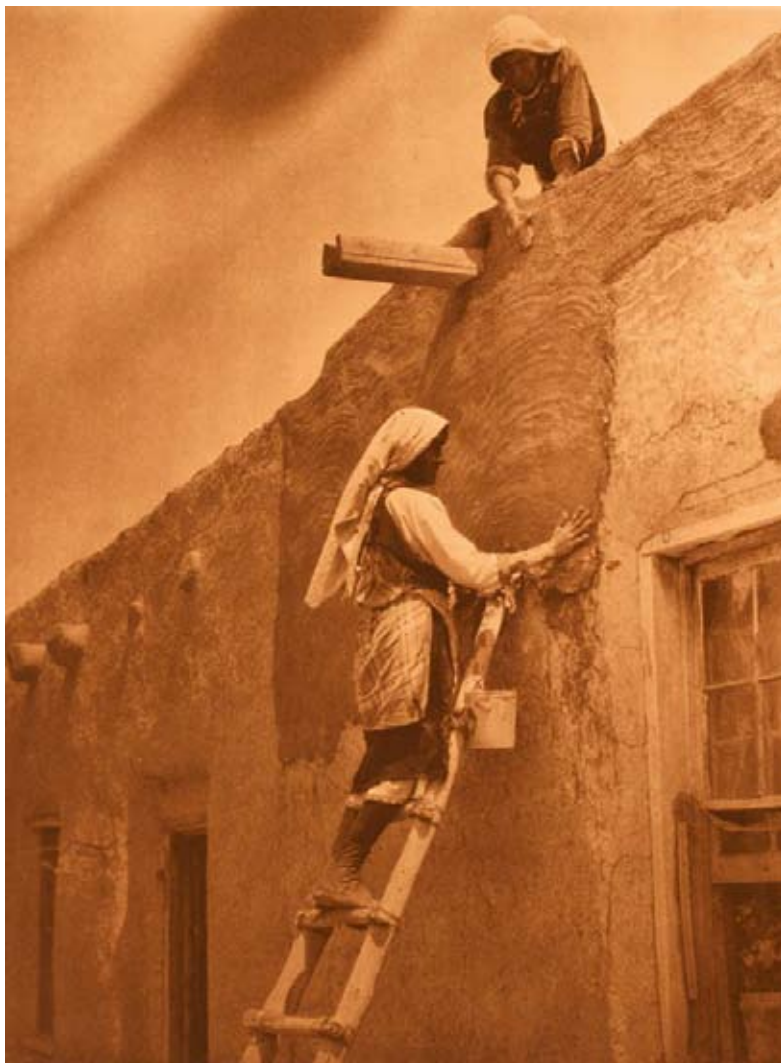
EDWARD S. CURTIS Replastering a Paguate House , 1925 Photogravure, 27 x 24 in. (68,6 x 61 cm).